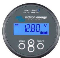
Détection Bluetooth BMV-712 Smart Battery Monitor