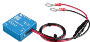
Détection Bluetooth Smart Battery Sense