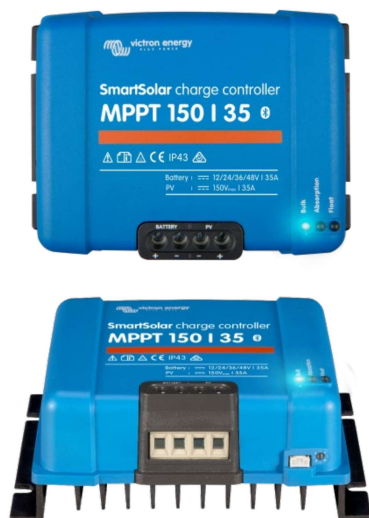
Contrôleur de charge SmartSolar MPPT 150/35

L'appareil se connectera à nouveau à une batterie au lithium-ion complètement déchargée disposant de la fonction de déconnexion interne.